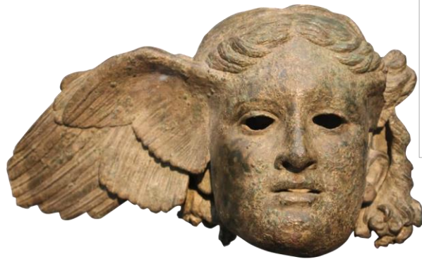
HYPNOS dieu du Sommeil et gardien de la Nuit - 1er-IIe siècle apr. J.-C. Copie d'un original grec - British Museum, Londres.