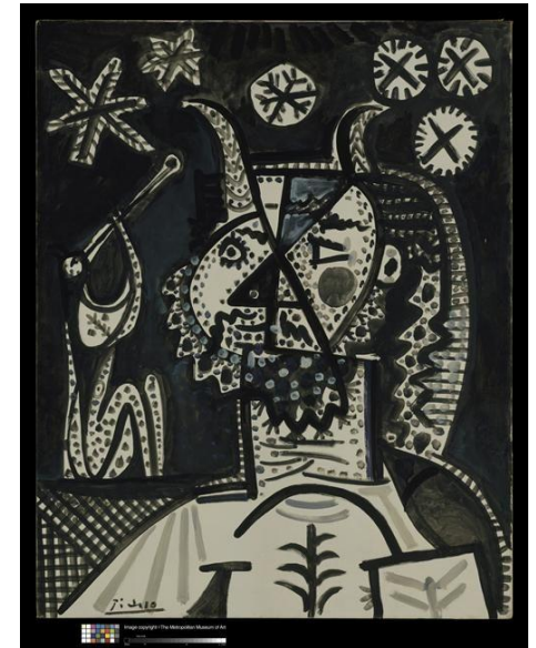
Faune et nuit étoilée 1957 Pablo Picasso