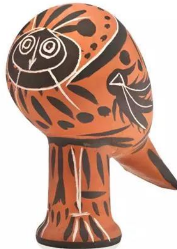
Pablo Picasso (1881-1973), Hibou 1953

Dans le baroque, l'équivoque est célébrée pour sa capacité à capturer l'émotion et la complexité de l'expérience humaine, contrairement au classicisme qui la perçoit comme une imperfection.