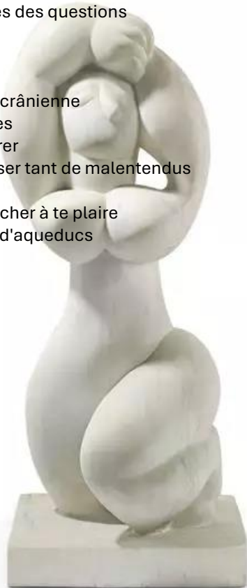
Henri Laurens(1885-1954) la lune, 1946

J'ai fait la saison dans cette boîte crânienne Tes pensées, je les faisais miennes T'accaparer, seulement t'accaparer D'estrade en estrade, j'ai fait danser tant de malentendus Des kilomètres de vie en rose Un jour au cirque, un autre à chercher à te plaire Dresseur de loulous, dynamiteur d'aqueducs